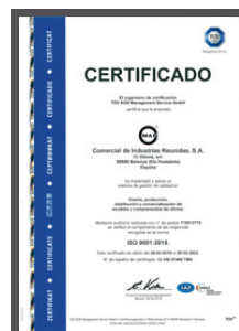
Certificado ISO 9001:2015