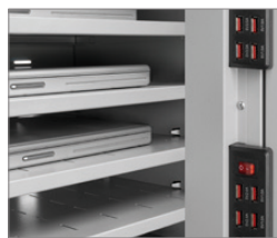
USB Organización eléctrica con hub USB de 10 puertos