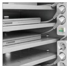
Organización eléctrica con regletas de 6 tomas