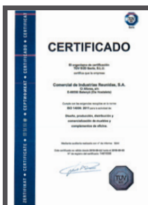
Certificado ISO 14006:2011