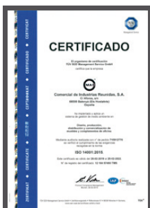
Certificado ISO 14001:2005